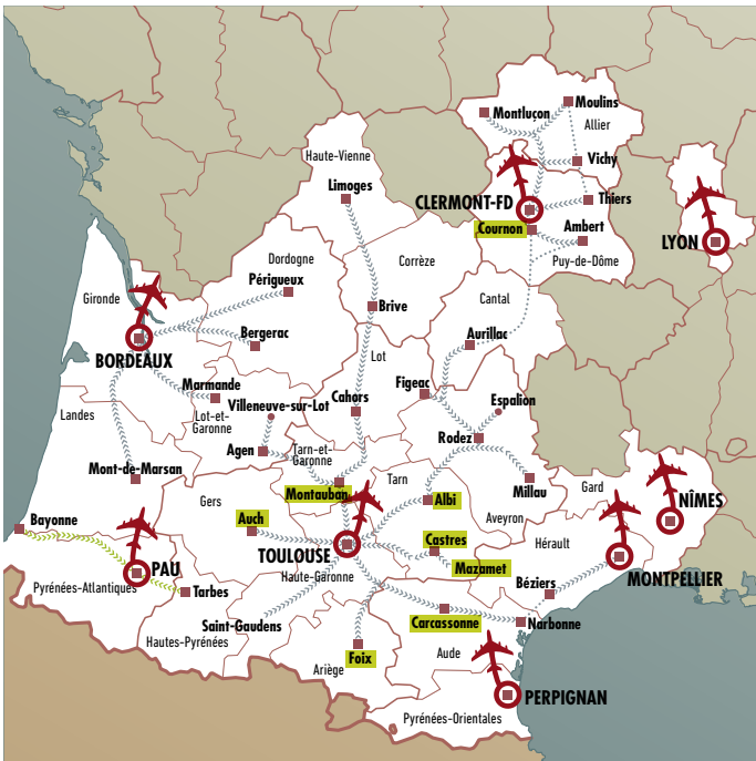
Axe 6 | Voyage en Avion vers Aéroport Paris