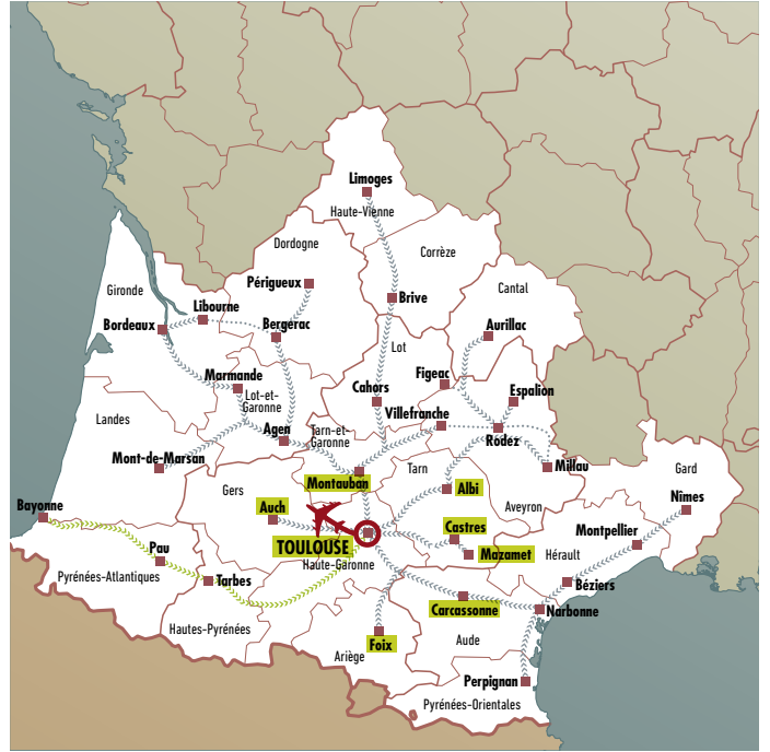
Axe 5 | Voyage en Avion vers Aéroport Toulouse