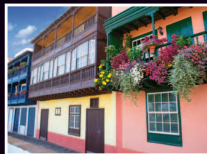
MAISONS COLORÉES DE SANTA CRUZ DE LA PALMA