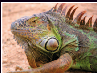
IGUANE GÉANT LORO PARQUE