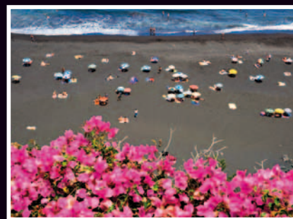
PLAGE DE SABLE VOLCANIQUE